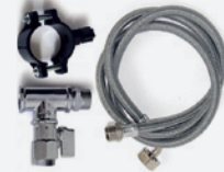
Kit di installazione Installation Kit