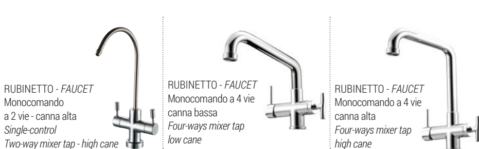
RUBINETTO - FAUCET Monocomando a 2 vie - canna alta Single-control Two-way mixer tap - high cane