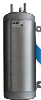
Carbonatore ODL ODL carbonator

EROGATORE D'ACQUA OSMOTIZZATA LISCIA E FRIZZANTE A TEMPERATURA AMBIENTE OSMOTIC WATER DISPENSER STILL AND SPARKLING WATER AT ROOM-TEMPERATURE