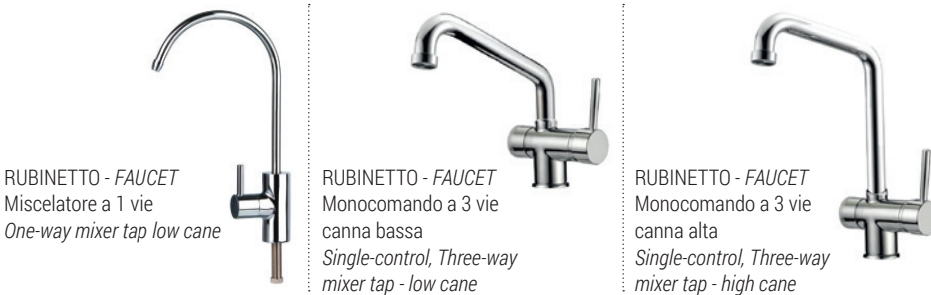
RUBINETTO - FAUCET Miscelatore a 1 vie One-way mixer tap - low cane